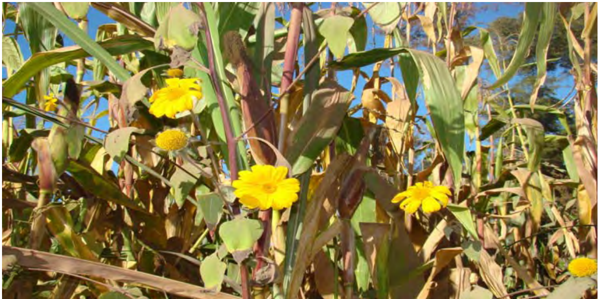
Plantación de maíz, Comunidad Las Trojes I

A continuación las siguientes imágenes que ilustran la situación actual de los cultivos de maíz en las comunidades Las Trojes I y II.